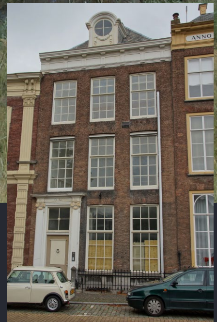
Middelburg, Dam 39, Rijksmonument en jarenlang de vredeslocatie van het Provinciaal Militair Commando Zeeland.

De bunker bleek een prima locatie zowel voor de interim inrichting van een commandopost als voor de latere definitieve commandopost voorzien van EMP-beveiliging.