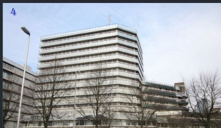
1. Vredes- tevens oorlogslocatie PMC-Utrecht anno 1987. Geheel links is de antennemast van het ASCON zichtbaar. 2. Villa Jongerius in verval na vertrek defensie 3. Villa Jongerius, Party- en Evenementencentrum anno 2015. 4. Lgen Knoopkazerne, modern kantorenpannd van de KL aan de Croeselaan, vredes- en oorlogslocatie van de PMC Utrecht vanaf 1987.