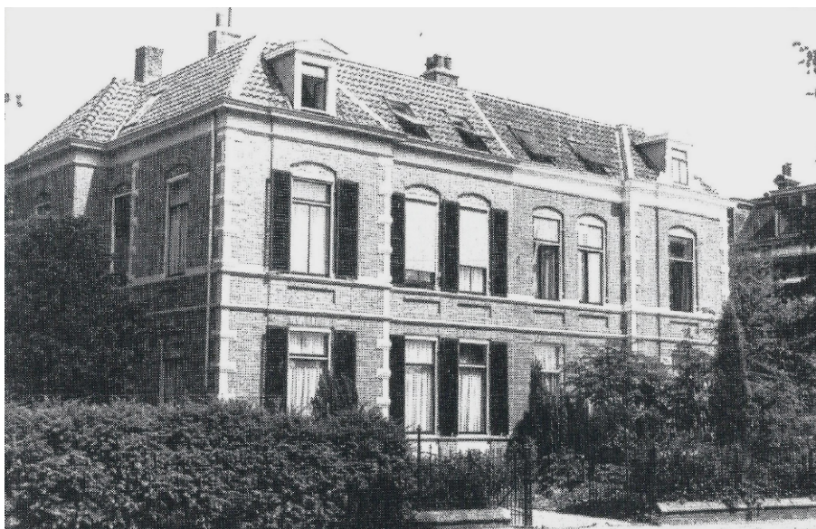
Deventer, Kapjeswelle 3, vredeslocatie PMC-Overijssel

Het pand aan de Kapjeswelle voldeed niet aan de vastgestelde criteria voor de inrichting van een oorlogscommandopost, waarop werd besloten een interim commandopost in te richten in het stafgebouw op de Westenbergka-