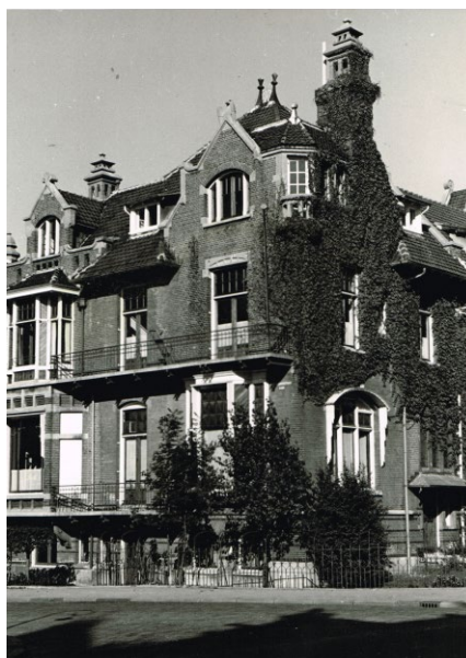
Villa aan de Van Eeghenstraat in Amsterdam, gedurende vele jaren het onderkomen van het Provinciaal Militair Commando Noord-Holland.

derkomen voor een commandopost voor het Provinciaal Militair Commando Noord-Holland werd besloten een interim commandopost in te richten in de Ripperdakazerne in Haarlem. Later kwam in Haarlem een bunker van de voormalige BB-organisatie beschikbaar voor de inrichting van een definitieve commandopost.