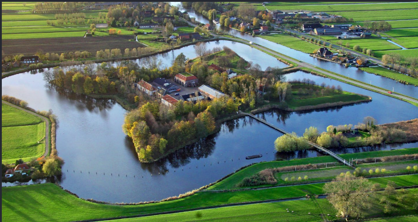
Voormalig Fort Wierickerschans met een rijke militaire historie, ook voor radioverbindingen tijdens de Koude Oorlog.