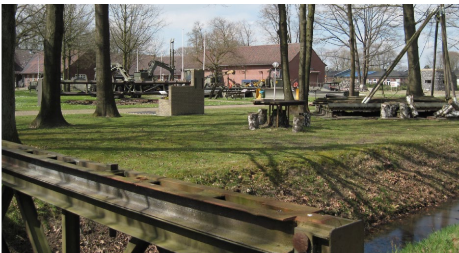
In het midden de aanbouw van gebouw K, te midden van de buitenopstellingen van de Historische Collectie van de Genie. (foto Ikol b.d. R.H. Rijntalder, apr. 2016)