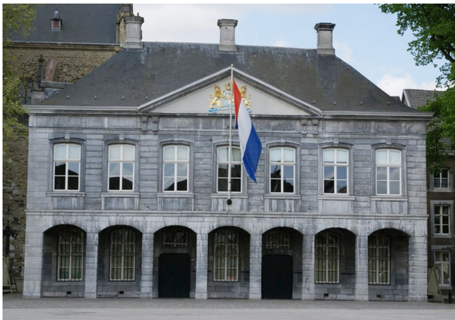
Hoofdwacht aan het Vrijthof in Maastricht, jarenlang de representatieve vredeslocatie van de Provinciaal Militair Commandant Limburg.

De werkgroep belast met de vaststelling van de locaties voor de oorlogsonderkomens van de PMC'n kwam met het voorstel om de OCP in te richten in de toenmalige Ernst Casimirkazerne in Roermond. Dit voorstel stuitte echter op heftig verzet van de zijde van de PMC. De PMC-Lb achtte het noodzakelijk dat de OCP in Maastricht zou komen.