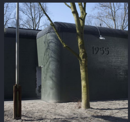
Goes, ingang van de bunker voor de luchtverdediging in de jaren vijftig; oorlogscommandopost voor de PMC-Zeeland tijdens de Koude Oorlog.