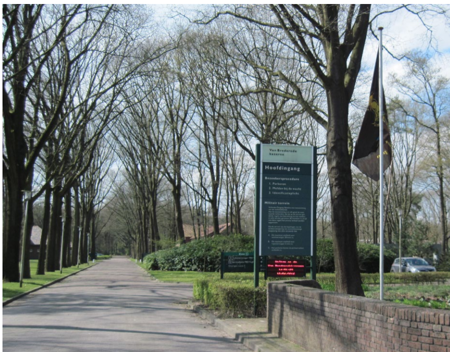
Ingang Van Brederodekazerne anno 2016; thuisbasis van de staf van het Genie Opleidingscentrum. Vanaf de oprichting in 1974 tot de opheffing in 1995 tevens de vredeslocatie van de PMC Noord-Brabant in gebouw N.

(Frederik Hendrik-, Lunetten- en Van Brederodekazerne) een uitgebreid programma vastgesteld voor de herschikking en nieuwbouw van de militaire infrastructuur. In het uitgebreide programma voor nieuwbouw en renovaties van gebouwen werd ook met prioriteit de nieuwbouw van een beschermd onderkomen voor het PMC- NBr opgenomen. Besloten werd om het regionaal verbindingscentrum van het AVKL (Algemeen Verbindingsstelsel Koninklijke Landmacht) in die regio te coloke-