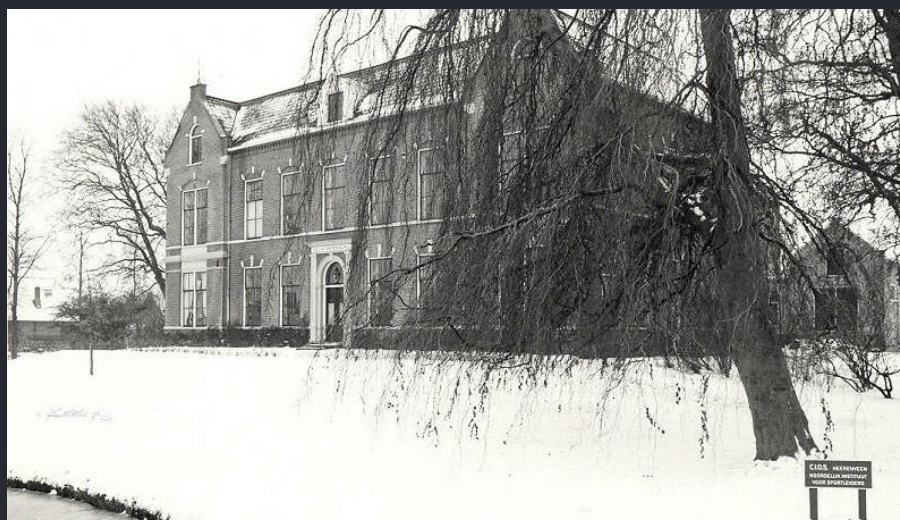
Het buiten Nieuw Friesburg in Heereveen; in de periode eind jaren zeventig/begin jaren tachtig het oorlogsonderkomen voor de PMC-Friesland. Op de voorgrond is het informatiebord van het CIOS nog net zichtbaar

Begin van deze eeuw verwierf het pand de status van Rijksmonument en werd er in de periode 2010 - 2012 een ingrijpende renovatie uitgevoerd. Het voormalige woonhuis van de familie Jonge-