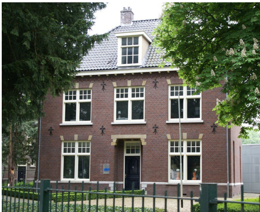
Villa aan de Hubertuslaan in Maastricht, in dit pand waren de telefooncentrale en het verbindingscentrum voor de PMC Limburg ondergebracht.

De strategische ligging van Maastricht ten opzichte van de buurlanden, de gewenste korte fysieke afstand tussen OCP en de locatie van het openbaar bestuur in de provincie en de aanwezigheid van het belangrijke NAVO-hoofdkwartier in de Cannerberg waren voor de PMC belangrijke redenen om in oorlogstijd in Maastricht te willen blijven.