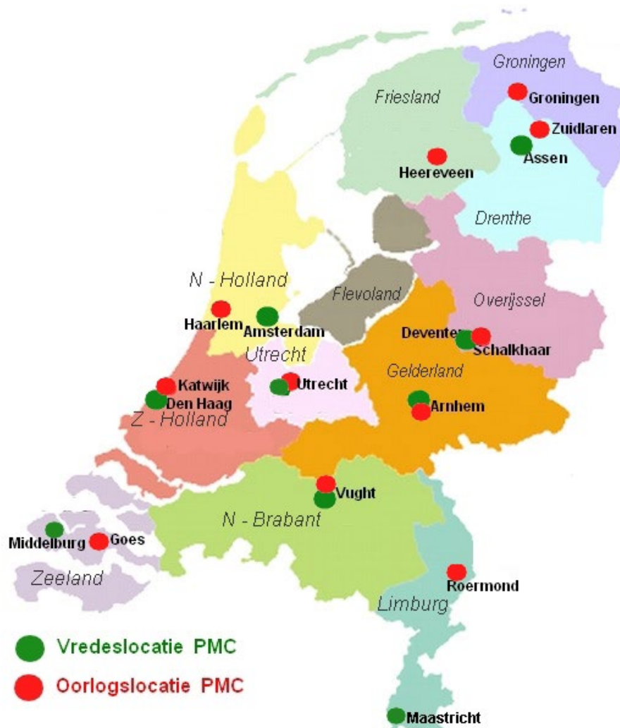
Overzicht locaties PMC'n in de periode 1970 – 1990

Enige tijd later verhuisde ook het verbindingscentrum vanuit Heemstede naar Amsterdam. In de voormalige Oranje-Nassaukazerne was een vleugel van het hoofdgebouw beschikbaar gekomen, waar na renovatie en aanpassing, een fraai verbindingscentrum werd gerealiseerd. Opmerkelijk is, dat als voorloper op de vestiging van een verbindingscentrum, in de Oranje Nassaukazerne in de 19e eeuw al een duivenonderkomen van de Militaire Postduivendienst was ondergebracht. In 1987 werden de PMC-NH en het verbindingscentrum weer geïncorporeerd in het voormalig kantoorpand van Getronics, dat door defensie was aangekocht voor de huisvesting van de vele kleinere verspreide onderdelen in Amsterdam. Onder de naam Kolonel Sixkazerne begon het kantoren-pand aan een nieuw leven. Aangezien er op korte termijn geen geschikte locatie beschikbaar was voor de inrichting van een beschermd on-