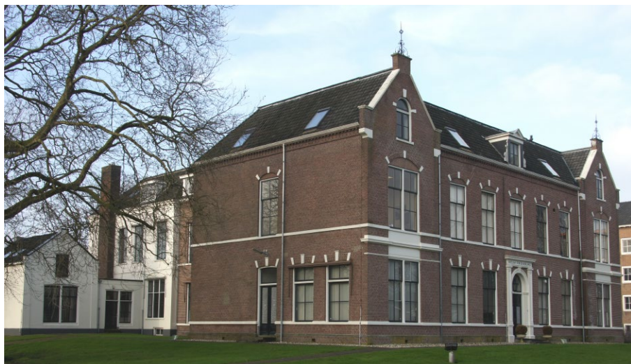
Nieuw Friesland, anno 2016, multifunctioneel bedrijfsverzamelgebouw.

den van de Conventie van Geneve. Om deze reden werd het project stopgezet. Wie zich nog eens wil verdiepen in de historie van de villa Nieuw Friesland, in de jaren tachtig met een oorlogsbestemming voor de staf van de PMC- Fr, kan de website van de geschiedenis van de wijk Heereveen-Midden eens raadplegen. Voor de provincie Drenthe werd besloten om zowel de interim-OCP als de toekomstige locatie voor de nieuwbouw van een beschermd onderkomen te projecteren op de Adolf van Nassaukazerne in Zuidlaren.