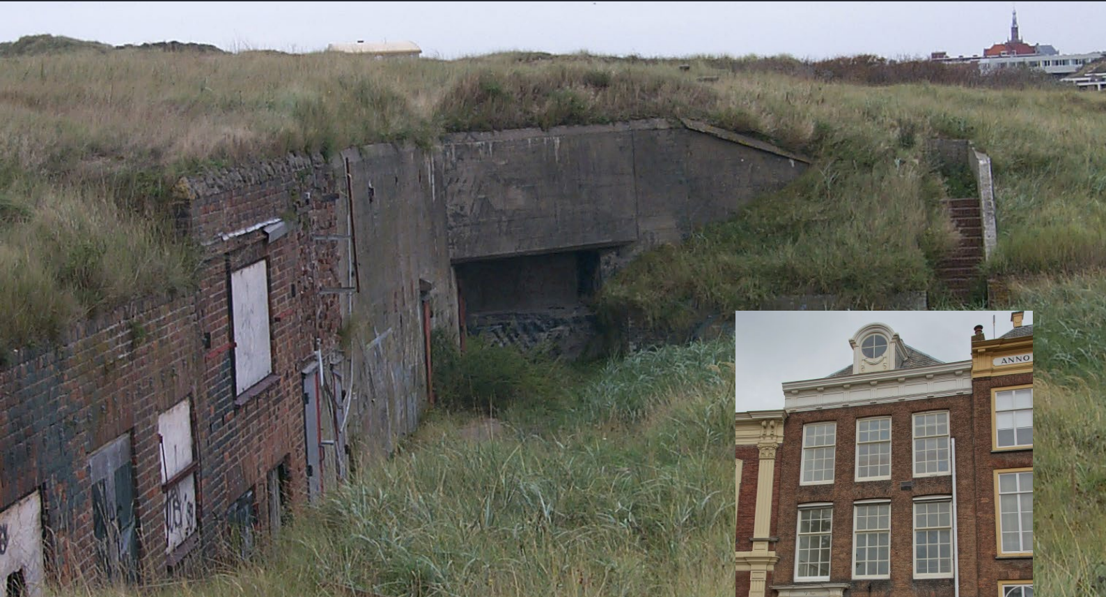
Duitse bunker 117 in de duinen bij Katwijk; in de jaren zeventig en tachtig in gebruik als commandopost voor de PMC Zuid-Holland.

Commando Verbindingen KL voor een van de radioparken. Begin jaren jaren zeventig beschikte de PMC-ZH in oorlogstijd nog over een zogeheten sectorcommandant in Rotterdam. De commandopost van deze sectorcommandant was ondergebracht in een bunker aan de Daltonlaan in Rotterdam. Deze bunker was tot de reorganisatie van het Korps Luchtwachtdienst van de Koninklijke luchtmacht in 1964 in gebruik geweest als luchtwachtcentrum. Deze bunker is inmiddels verdwenen en niets op deze locatie herinnert meer aan de militaire aanwezigheid tijdens de Koude Oorlog.