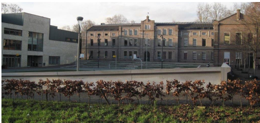
Terrein van voormalige Menno van Coehoornkazerne anno 2016

gingsplaats van het in 1970 opgerichte PMC-Gld.